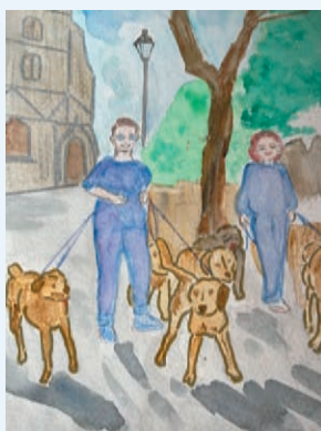
スタンディング百合子