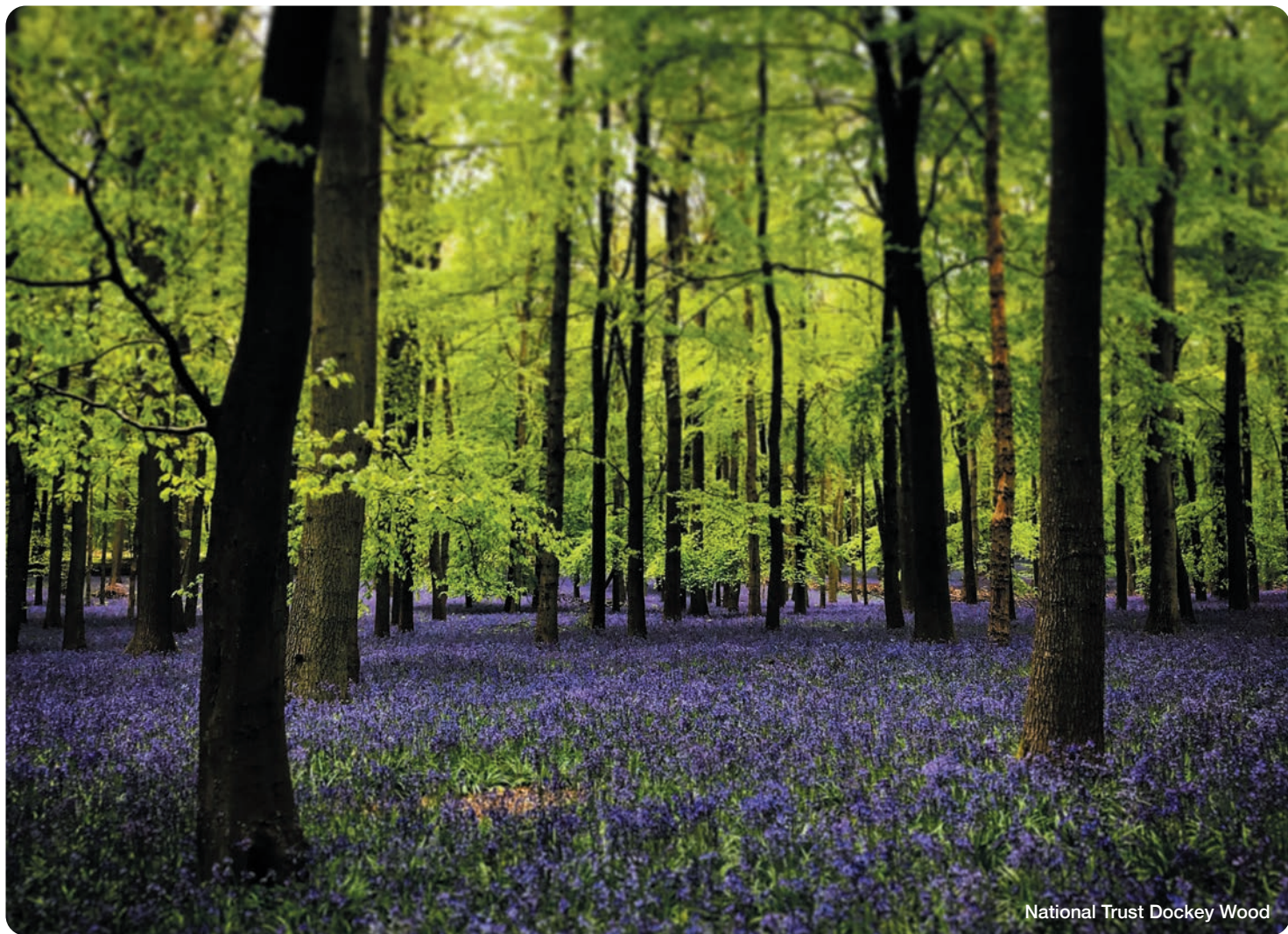
National Trust Dockey Wood