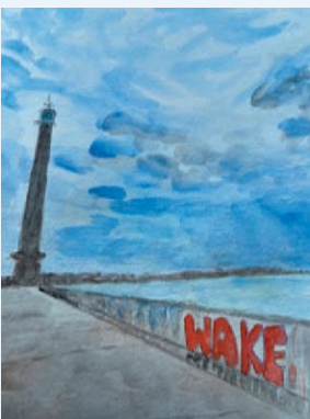
スタンディング百合子