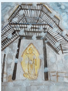
スタンディング百合子