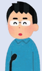
日本語スピーチコンテスト

備考: 会場への入場はどなたでも無料ですが、事前予約が必要です。登録方法などの詳細は英国日本語教育学会ホームページ ( https://batj.org.uk/ ) をご覧下さい。