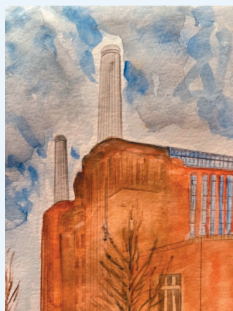
スタンディング百合子