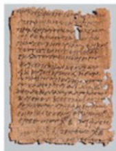
パピルスに古代ギリシア語で書かれた手紙(紀元前3世紀ころのもの)