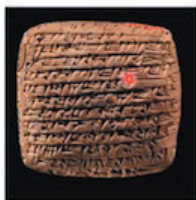
粘土板に楔形文字で書かれた私的な手紙の一例(紀元前17世紀～紀元前16世紀ころのもの)