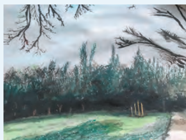
シェイラ文野 ＜1月の曇り空の下、 ジョギングルートにて＞