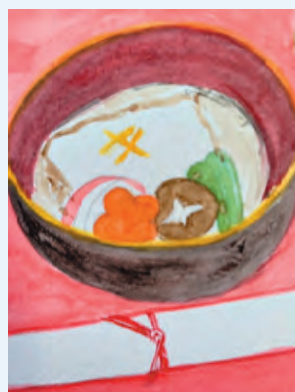
スタンディング百合子 ＜お雑煮＞