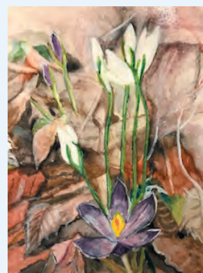
ハーティみえ ＜スノードロップ＞