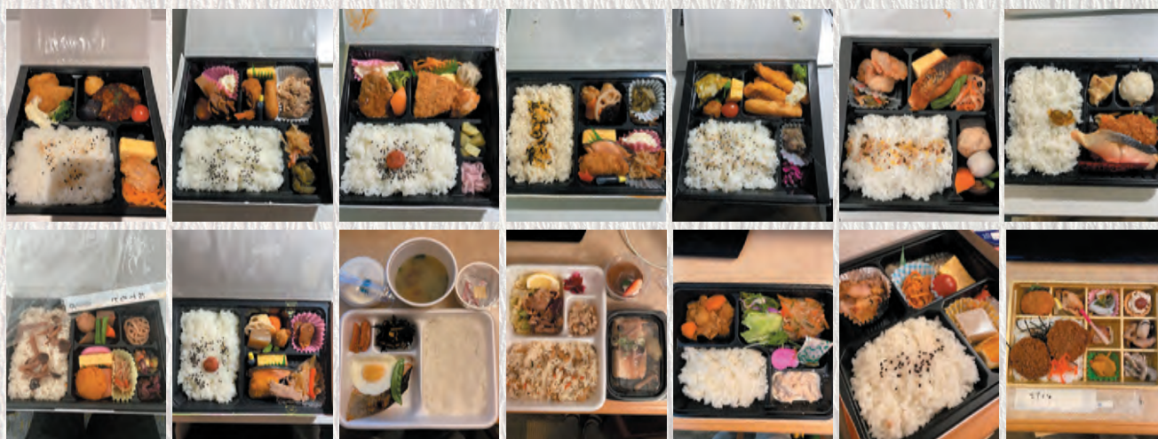
日本での隔離中（強制6日間+濃厚接触者隔離8日間）の食事は毎日3食ホ弁当！？ 編集部