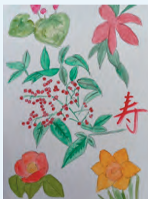
スタンディング百合子 ＜一月の花＞