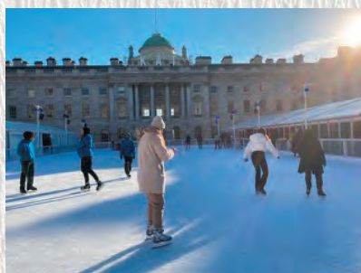
Somerset House スケートの風景 ウィンター千津子さん