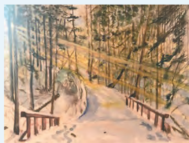
ハーティみえ ＜木漏れ日の初日の出＞