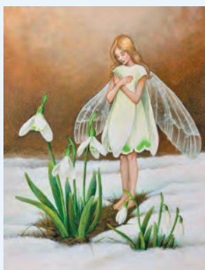
ビドル恵 ＜スノードロップと妖精＞