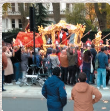
Lord Mayor Parade ウィリアムズ百子さん