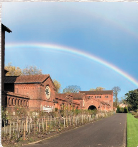
Full Rainbow バンダースケイ7日出美さん