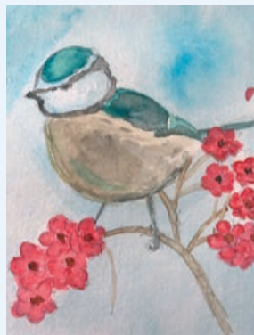
スタンディング百合子