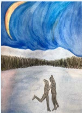
スタンディング百合子