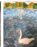
スタンディング百合子