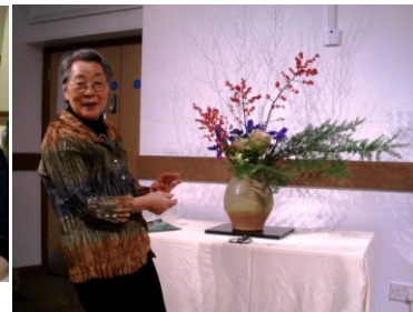
花の活け込み完了