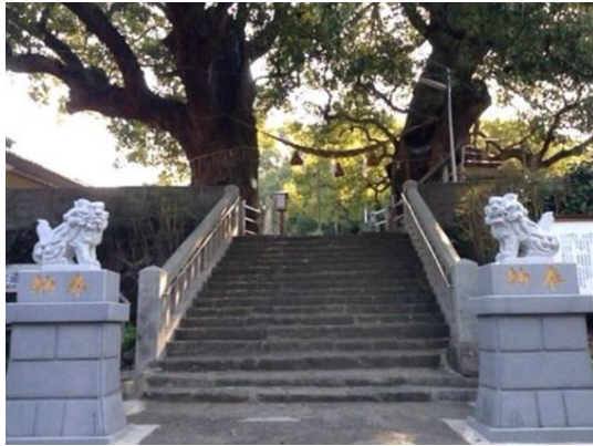
長崎の被爆クスノキ

我が魂はこの土に根差し／決して朽ちずに決して倒れずに／我はこの丘 この丘で生きる／幾百年越え／時代の風に吹かれ／片鳥居と共に／人々の営みを／歓びを かなしみを／ただ見届けて／我が魂は／奪われはしない／この身折られど この身焼かれども／涼風も爆風も／五月雨も黒い雨も／ただ浴びてただ受けて／ただ空を目指し／我が魂はこの土に根差し／葉音で歌う