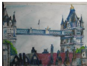
グリーブスくにこ

来てくれるだろうと心配したが何と 9 人の参加となった。駅の西側に海軍の戦没慰霊と昔の処刑場跡のある小公園があり、人通りも少なくベンチも多いので、絵を描くには最適と思っていたのに残念ながらの雨。どうしたものかと思っていたら誰かが角の PAP を見つけた。中に入ると 2 階もあり、ロンドン塔やタワーブリッジも良く見え雨のせいか空いていたので、そこで描く事に決まった。鉛筆でサッサと始める人、水彩で描く人、写真を撮る人、1 時間は直ぐに過ぎた。ランチは Blackfriars の日本レストランへ。暖かい場所でリラックスして食べた和食はことの外美味しく感じた。